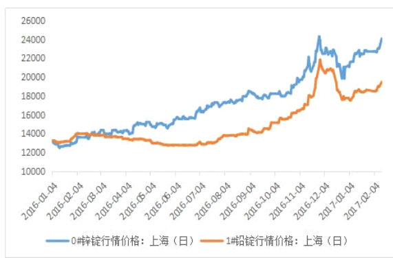
铅锌主流地区期货库存图