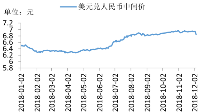
美元兑人民币中间价