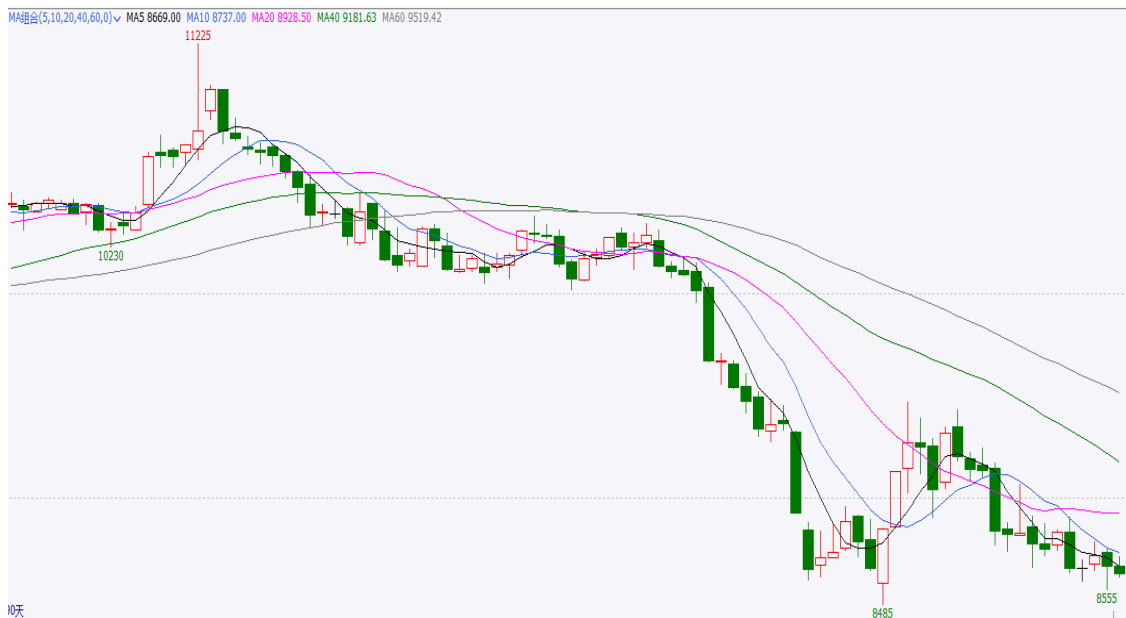
图 3 90 日期货行情走势

截止本周四，红枣期货合约 CJ109 开盘 8670，最高 8715，最低 8615，收盘 8635，涨-15 元/吨，涨幅-0.17%，成交量 44636 手，持仓量 45806 手，日增仓 290 手。