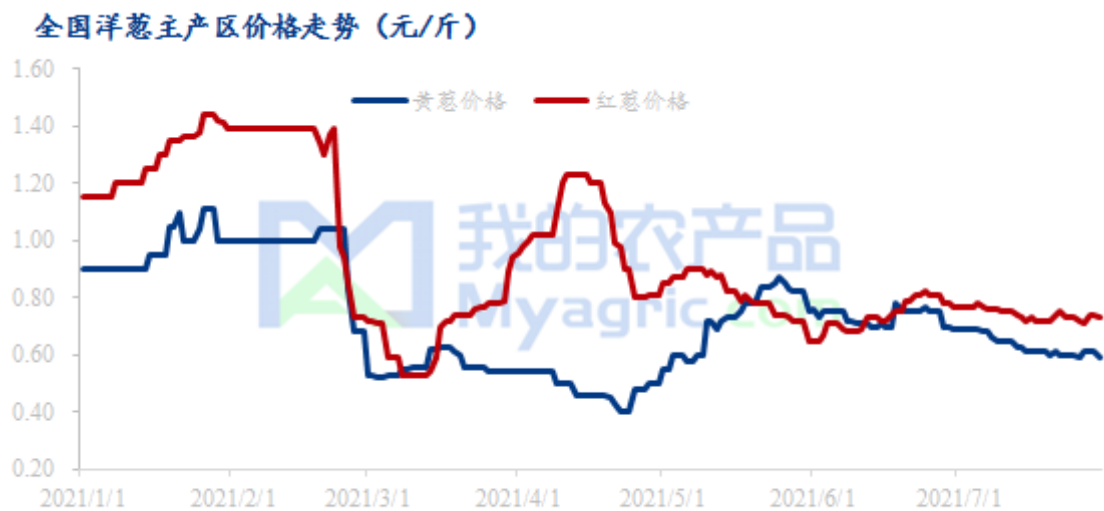
表 1 中国洋葱价格走势图

注：表中为当地主流成交价格区间的均价，与最高价和最低价均有一定差距。实际成交过程中，根据实际质量有浮动