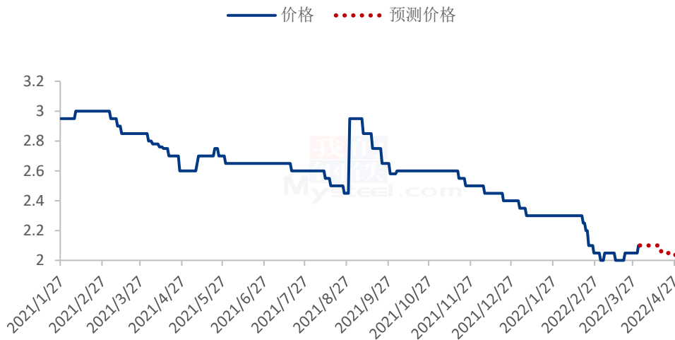
(2021-2022年) 赤峰张杂13号谷子价格走势 (元/斤)

Mysteel 农产品认为短期市场将延续稳定态势，应暂无较大波动。若后期交通情况有所改善，届时市场供应增加，市场价格下滑风险犹存。