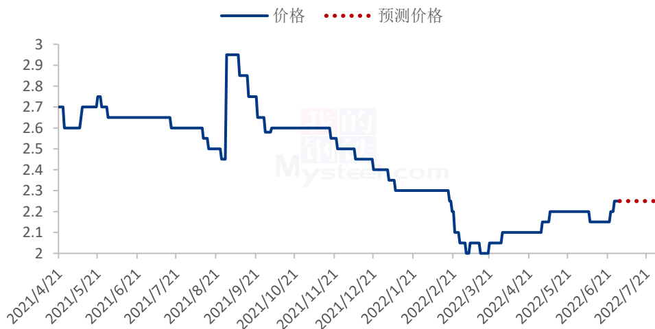
(2021-2022年) 赤峰张杂13号谷子价格走势 (元/斤)

后期市场关注重点应集中在新谷长势情况上，天气、温度等情况或也将对产量造成影响，进而影响市场心态变化。