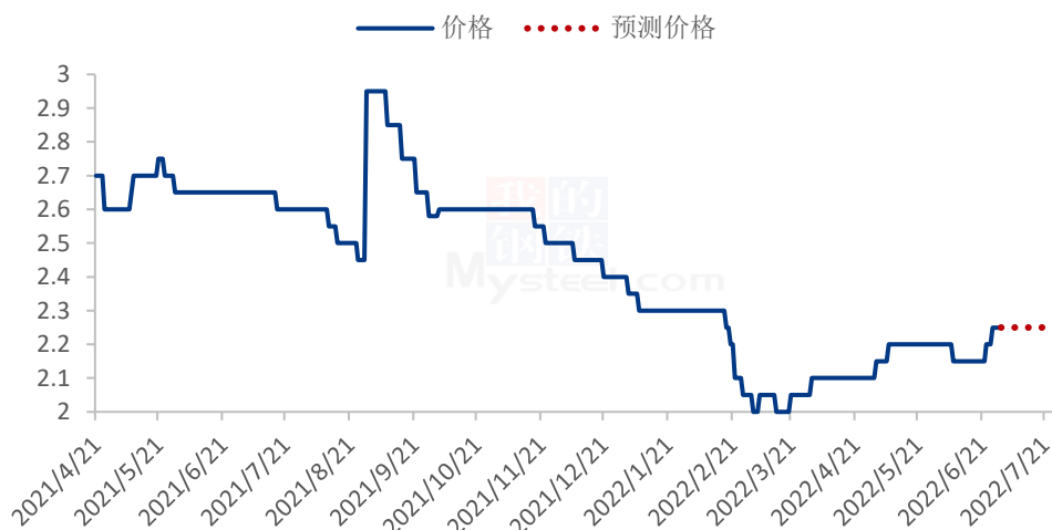
(2021-2022年) 赤峰张杂13号谷子价格走势 (元/斤)

产区降水充足，后期随着时间推移，农户出货心态或有改善，届时供应量增加，价格存在小幅下调风险，但整体下滑空间有限。同时，农户对当前价格相对认可，但低价惜售，持货千吨以上及个别万吨级粮商挺价心态持续，不排除继续压货可能。