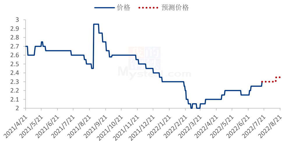
(2021-2022年) 赤峰张杂13号谷子价格走势 (元/斤)

当前谷价波动脱离了市场供需基本面，仅靠产区部分粮商大量收购抬价引起，新谷上市前市场供需矛盾仍然较为突出，短期内谷价稳中或存小幅上涨契机。