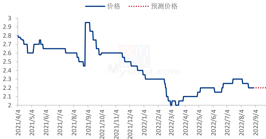
(2021-2022年) 赤峰张杂13号谷子价格走势 (元/斤)

目前下游市场流通小米以山东河南新米和部分陈米为主，九月下旬开始，东北谷子将陆续收割上市，新谷大量上市后供应量增加，可供市场选择的新陈谷子较多，价格应有所下调，临近收割还需关注产区天气状况。