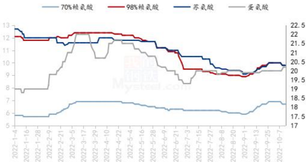
国内氨基酸市场价格走势图（单位：元/公斤）