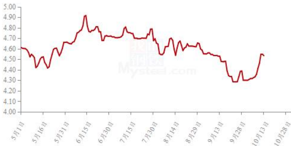
全国白羽肉鸡均价走势图（元/斤）