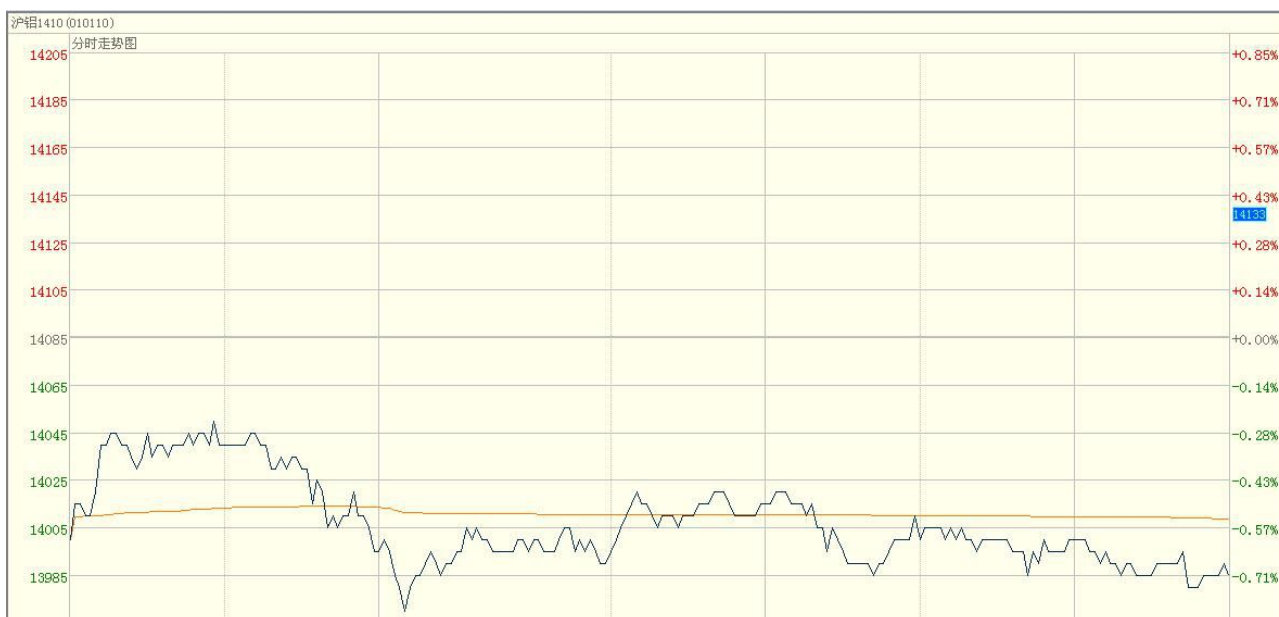
图一 电解铝主力合约（1410）分时图