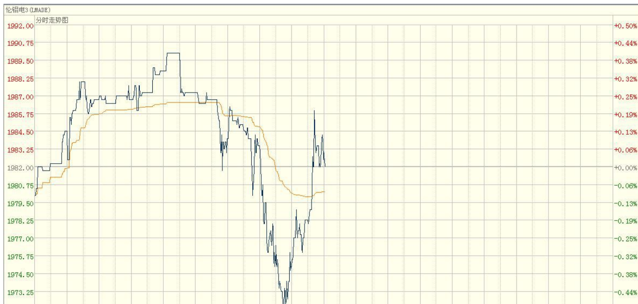
图四 LMEs_铝分时走势图（亚洲时段）

上周五，伦敦铝开盘于 1990 美元，最高点报 2004.5 美元，最低点报 1968 美元，最终收盘于 1982 美元，较前一交易日收盘价下跌 8.25 美元，跌幅 0.41%。今日亚洲交易时段，伦铝震荡运行。