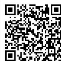
(期、现货铝交易微信)