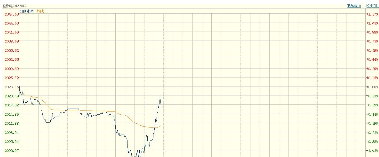
图四 LME3-铝分时走势图（亚洲时段）