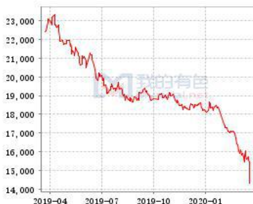
锌 SHFE 锌锭库存走势图