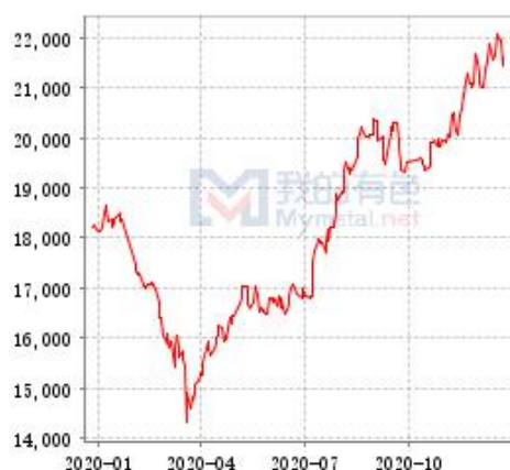
锌 SHFE 与 LME 锌锭库存走势图